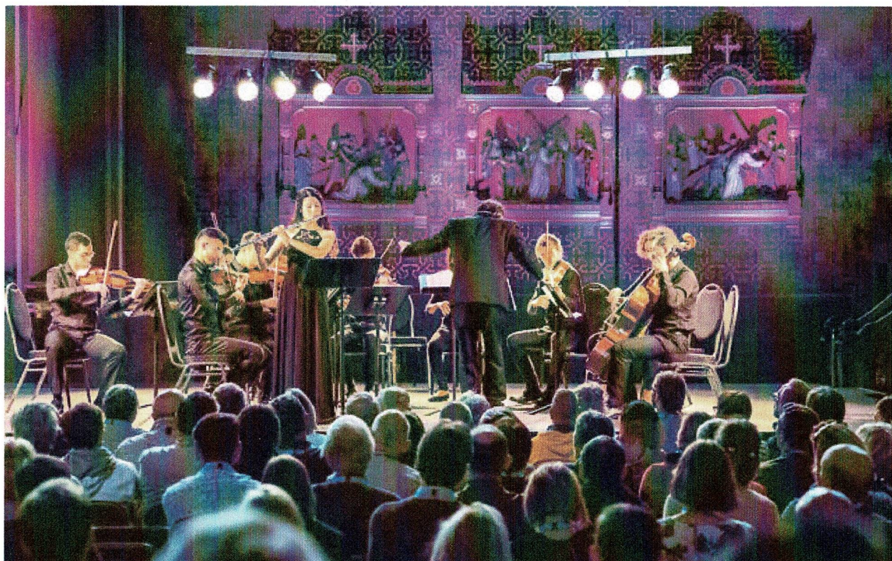
Les jeunes musiciens de Polyphonie Nazareth, conservatoire de cette ville arabe du nord du pays qui a changé l'exposition des Arabes israéliens à la musique classique

Nazareth est une ville connue pour ses églises, sa cuisine galiléenne et son histoire de Noël. Mais elle abrite également Polyphonie – premier conservatoire de musique classique de la communauté arabe israélienne.