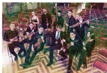
De jeunes musiciens de Polyphonie Nazareth